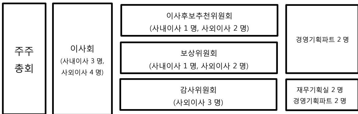
(표 4-1-2) 이사회 구성 현황